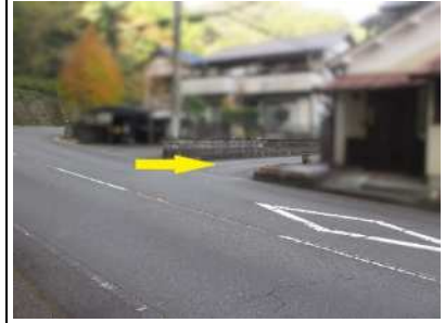
公図①付近から撮影